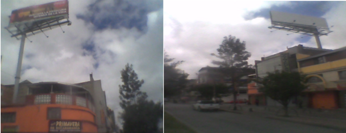
Vista Sentido Norte-Sur